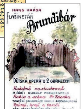
Plakát dětské opery Brundibár