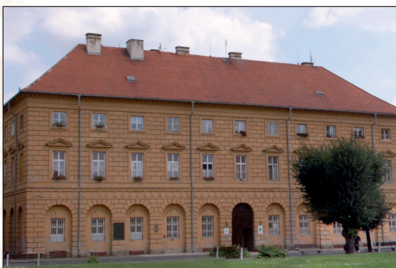
Současný obrázek budovy L 410