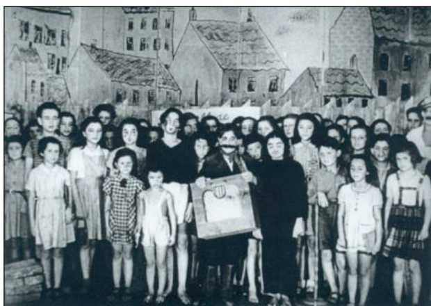
Účinkující v dětské operě Brundibár, Eva jim trochu záviděla.

Slova této hymny, tajné přísahy dívek z pokoje 28 dívčího domova L 410 v Terezíně zapůsobila na mnohé čtenáře. Byla to hymna dívek, které držely při sobě. Snažily se pomáhat si. V této životní situaci to šlo sice těžko. Většina nepřežila. Ostatní se ale dodnes scházejí. Vzpomínají na ty těžké časy. Nemyslí se na ně hezky, ale s úsměvem vzpomínají na hru, divadlo Brundibár a pěkné časy, které v pokoji 28 strávily.