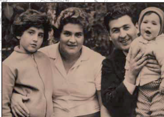
Jako dospělá se svými dětmi a mužem