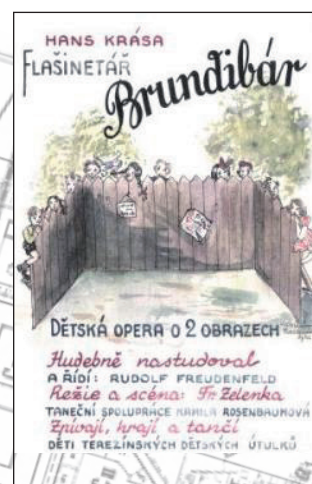
Plakát na dětskou operu Brundibár